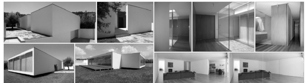
HABITAÇÃO LOPES . HOUSE LOPES Habitação Unifamiliar . Single-Family House, Braga