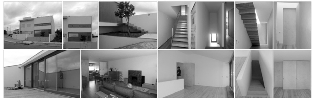
HABITAÇÃO CARVALHO . HOUSE CARVALHO Habitação Unifamiliar . Single-Family House, Matosinhos