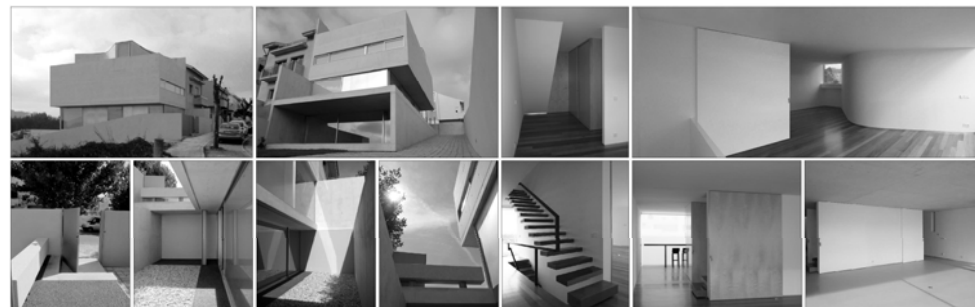
HABITAÇÃO COSTA . HOUSE COSTA Habitação Unifamiliar . Single-Family House, Valongo