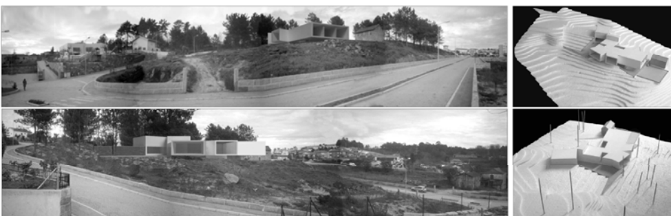
HABITAÇÃO MOREIRA. HOUSE MOREIRA Habitação Unifamiliar . Single-Family House, Marco de Canavezes