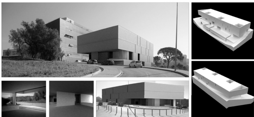
EDIFÍCIO DE BIOMED . BIOMED BUILDING Centro de investigação BIOMED . Research Center BIOMED, Universidade Coimbra