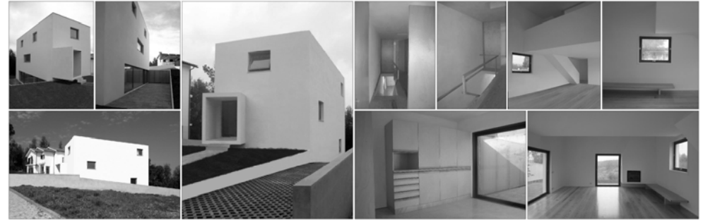
HABITAÇÃO VITERBO CORREIA . HOUSE VITERBO CORREIA Habitação Unifamiliar . Single-Family House, Coimbra