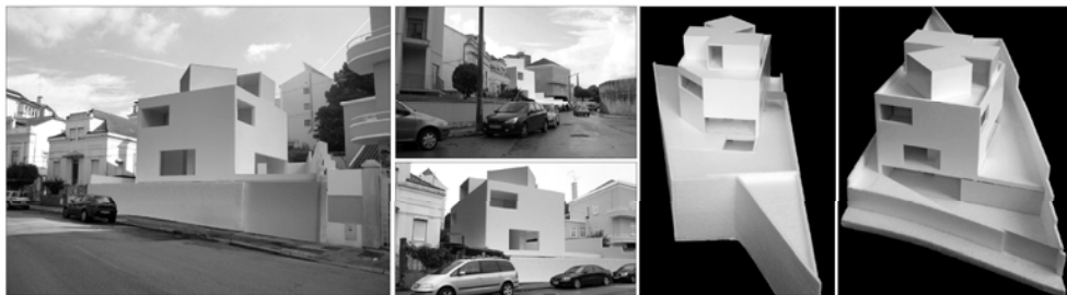
HABITAÇÃO GUILHERME TRALHÃO . HOUSE GUILHERME TRALHÃO Habitação Unifamiliar . Single-Family House, Coimbra