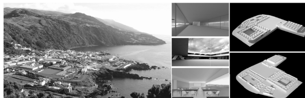
ESCOLA DE VELAS . SCHOOL OF VELAS Escola 1, 2 e 3 ciclo da EBS de Velas . 1sh, 2nd, and 3th Cycle EBS of Velas, São Jorge, Açores